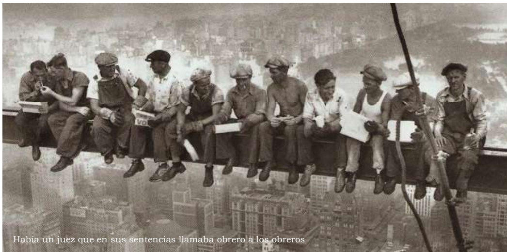
Había un juez que en sus sentencias llamaba obrero a los obreros