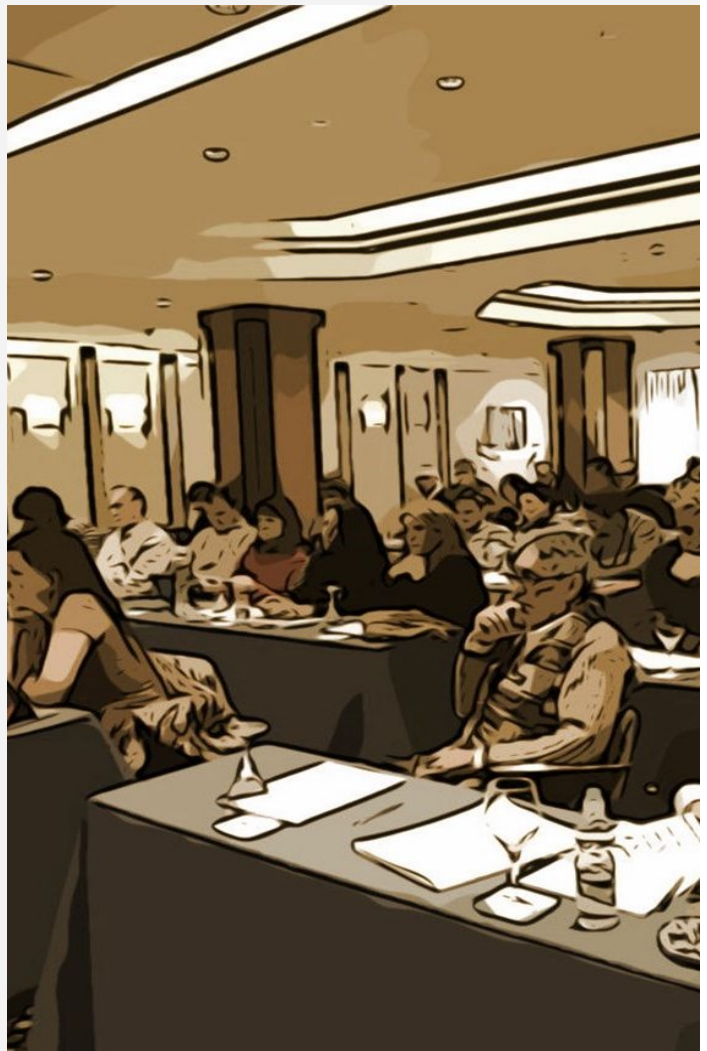
Comité Permanente. 7 y 8 de febrero de 2013. Valladolid