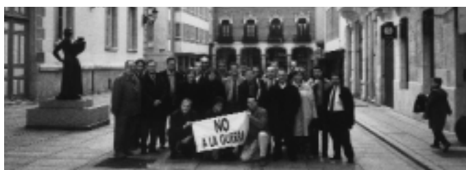
Los secretarios de UPF y JpD en Palencia

de que esta guerra unilateral, que toma como pretexto una campaña mundial contra el terrorismo y contra los países supuestamente amigos de los terroristas, constituye una quiebra de la paz y una vulneración de