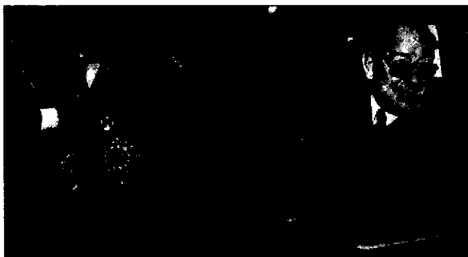
Cardenal y Fungairiño, protagonistas de la crisis