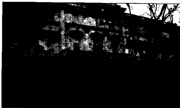
El CGPJ convoca el primer Congreso de Jueces de Pueblo