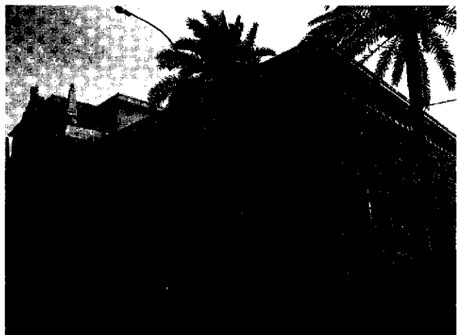
Juzgados de Cádiz

La que suscribe —en su condición de miembro electo de la SG por JpD— solicitó al Pleno que revisara el Acuerdo de la Comisión y se limitara a "darse por enterada" de las exposiciones de las JJ. Sustancialmente se exponía que la SG carecía de competencia para revisar o anular los acuerdos de las JJ —salvo en materia de normas de reparto— y carecía de facultad para controlar o supervisar los acuerdos de otro órgano de gobierno como es la JJ, que sólo podrán quedar ineficaces por vía de recurso o por revisión de los propios actos. En marzo del presente año, el Pleno acordó estimar la petición de revisión "solamente en el particular referente a la