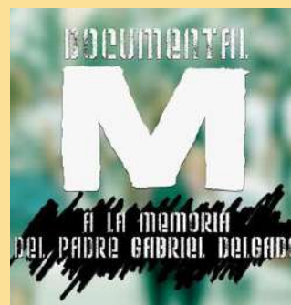
Viernes 31 /11:30 h. DOCUMENTAL "M" LA VOZ A ELLOS DEBIDA