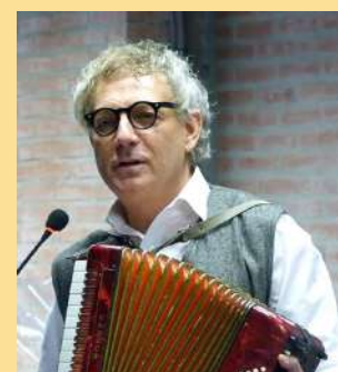
Viernes 31 /19:00 h. JUAN CARLOS MESTRE POETA